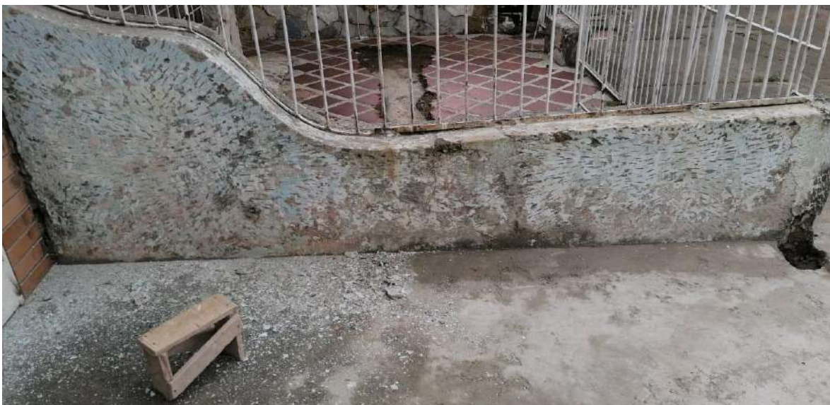
Parte lateral del inmueble de la señora Aleyda y que perjudicaba el mio