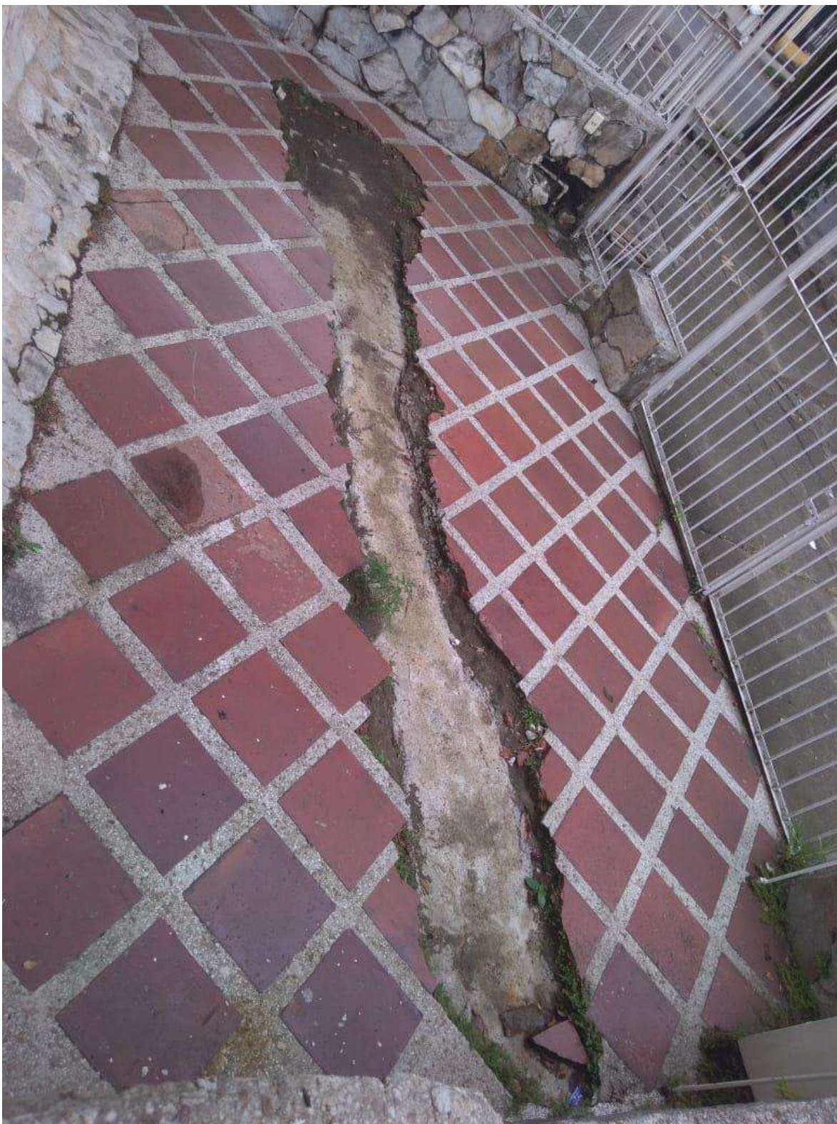
Foto del sitio donde se realizó la obra y donde hay que reponer las baldosas