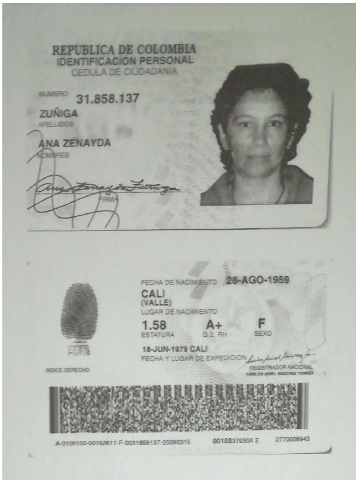
Fotocopia de document de identidad